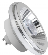
MEGAMAN® LED AR111