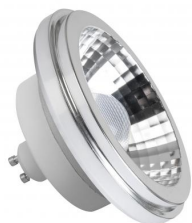
MEGAMAN® LED AR111