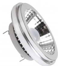
MEGAMAN® LED AR111