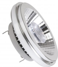
MEGAMAN® LED AR111