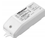
MEGAMAN® LED AR111